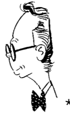
Morris, iun genio del noveno arte!

El padre de Lucky Luke nació en 1923 en Courtrai, Bélgica. Tras unos inicios en estudios de dibujos animados, crea Lucky Luke, su universo y los principales personajes de la serie, cuyas aventuras aparecerán en el Almanaque de Spirou en 1947. Es entonces cuando recorre Estados Unidos durante unos años con sus amigos André Franquin y Joseph Gillain al igual que las estrellas de la revista satírica Mad: Kurtzman, Davis y Wood. Lucky Luke se coloca muy rápidamente entre los ineludibles del cómic gracias al grafismo simple, expresivo y eficaz de su autor. Su sentido de la fórmula le inspirará también las expresiones: “el hombre que dispara más rápido que su sombra” y “novenno arte”