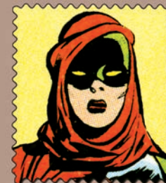
Doncella de Nueve

¿Pertenece a la Novena Cruzada? ¿Pudo combatir en ella? Su máscara y su armadura ocultan demasiados secretos.